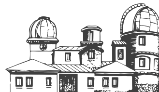
Slovenská ústredná hviezdáreň v Hurbanove

Slovenská Astronomická Spoločnosť pri Slovenskej akadémii vied